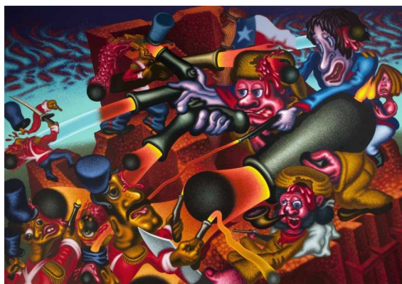
The Alamo, 1990 huile et acrylique sur toile 213 x 305 cm © Peter Saul