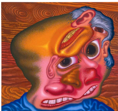
Panic Attack in The Lumber Yard, 2007 Acrylique et huile sur toile 183 x 199 cm