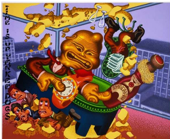
Chinese businessman Lands on Wall Street, 2006 acrylique sur toile 198 x 244 cm