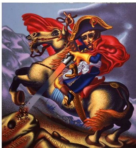
Napoleon crossing the Alps, 1995 acrylique sur toile 170 x 140 cm