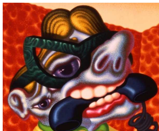
Telephone Call, 1988 acrylique sur toile 183 x 214 cm Photo: © Peter Saul